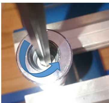
Billede 2. Sænk trykket